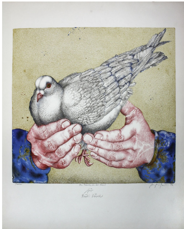
Prinz Kuckuck. Farblithographie, 1977, Probedruck. Handschriftlich mit Blei „Prinz Kuckuck, Prinz Kuckuck macht Fr. Frühling ein blumiges Kind“. Signiert. 50 : 37 cm.