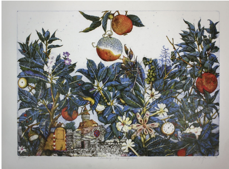
In meinem Garten Eden. Farblithographie, 1977, Probedruck. Widmungsexemplar für seinen Drucker R.Lösel . Signiert. 43 : 60 cm.