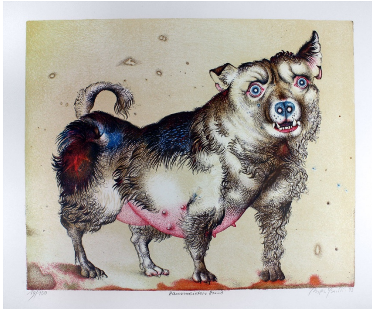
Die Taube in der Hand. Farblithographie, 1973, Probedruck. Widmungsexemplar für R.Lösel. Signiert. 40 : 42 cm.